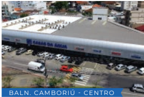
BALN. CAMBORIÚ - CENTRO