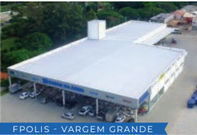
FPOLIS - VARGEM GRANDE